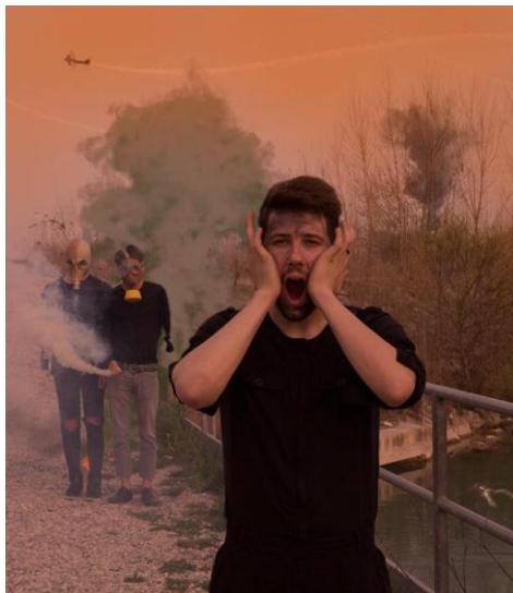
La disperazione del grido si manifesta ai giorni nostri nella reazione alle atrocità della guerra.